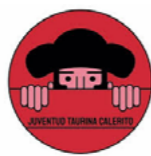
Juventud Taurina Calerito