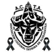
Asociación Cultural Taurina de 'Aldeadávila de la Ribera'