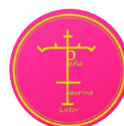
Peña Taurina Lietor