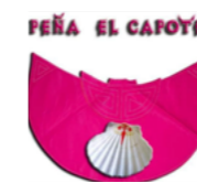
Peña taurina 'El Capote'