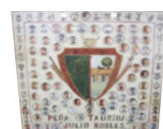
Peña Taurina 'Julio Robles'