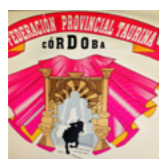
Federación Provincial Taurina de Córdoba