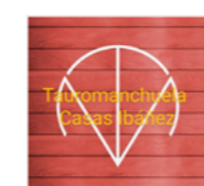
Peña Tauromanchuela Casas Ibáñez