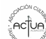
Asociación Cultural Taurina de la Universidad de Albacete (ACTUA)