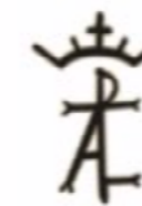
Asociación Cultural Taurina "Aficionados del Toro Villa de Iniesta"