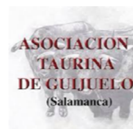
Asociación Taurina de Guijuelo