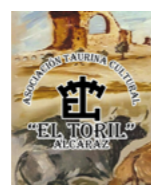
Asociación Taurina Cultural "El Toril" de Alcaraz