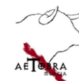
Asociación para el Estudio del Toro Bravo de la Universidad de Murcia (AETOBRA)