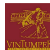
Peña Taurina 'Vintumperio' de Pontevedra