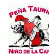
Peña Taurina 'El Niño de La Capea'