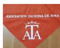
ATA, Asociación Taurina de Ayna (Albacete)