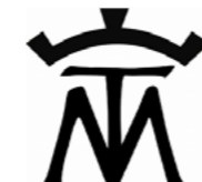
Asociación Taurina Cultural 'Media Verónica de Macotera'