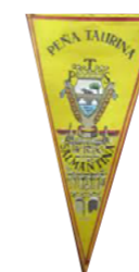
Peña taurina salmantina