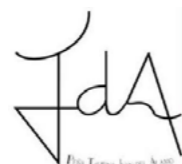
Peña Taurina Juan del Álamo